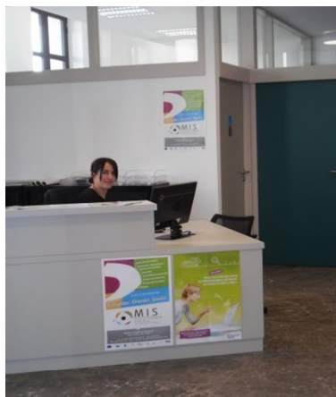
Une chargée d'accueil pour vous guider