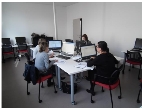
Salle informatique 11 postes