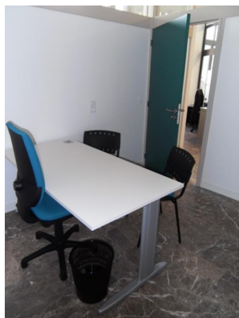
Bureau de permanence