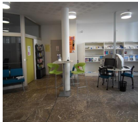
postes informatiques en libre-service.