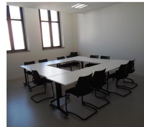
Salle de formation 15-20 places

Equipement ayant reçu le soutien financier de